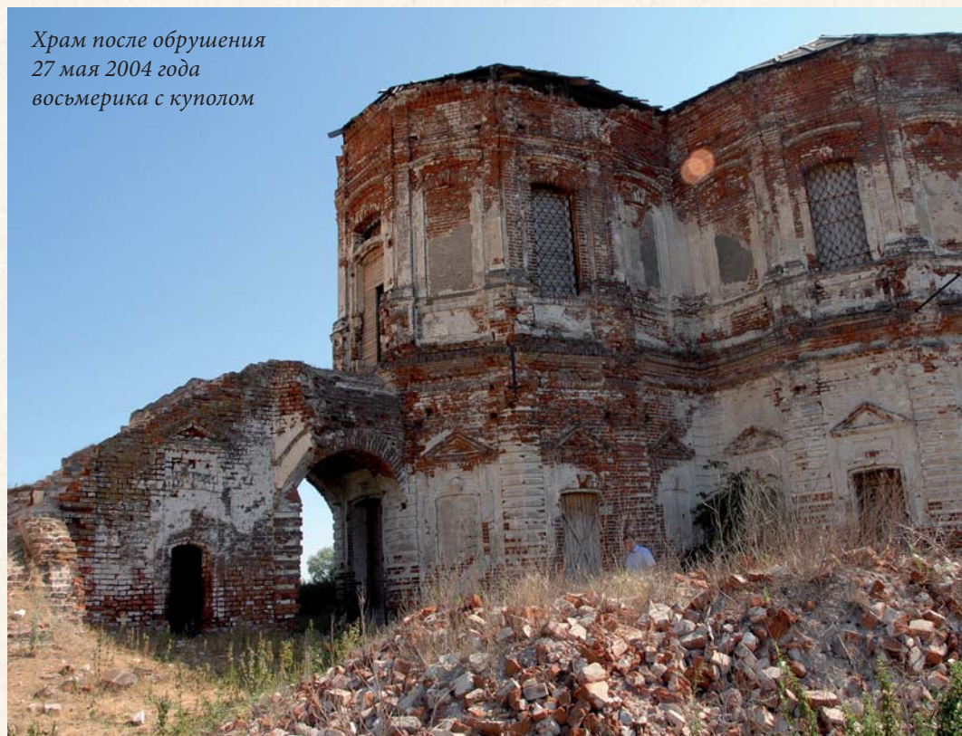
Храм после обрушения 27 мая 2004 года восьмерика с куполом