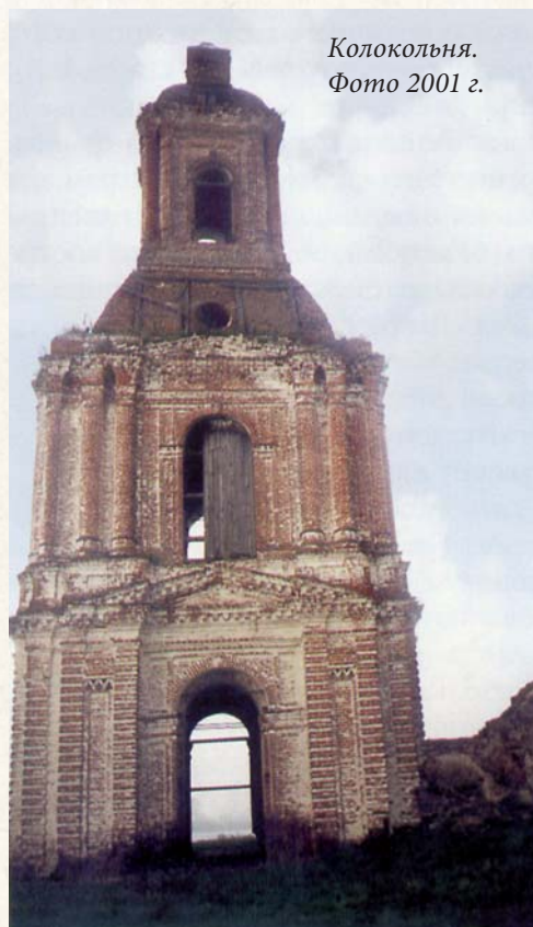
Колокольня. Фото 2001 г.