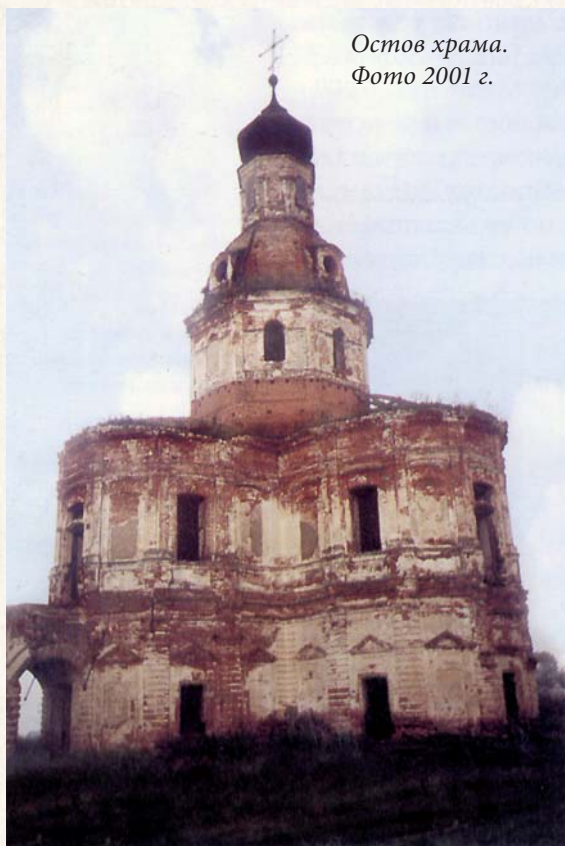
Остов храма. Фото 2001 г.